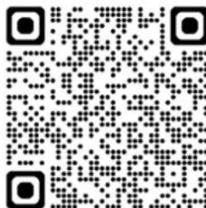
QR-kod till Joyna - Skirö AIK

Om 50 medlemmar prenumererar på en lott varje månad så får Skirö AIK 30 000:-/år. Vinner du på din lott så vinner dessutom vi som förening lika mycket!